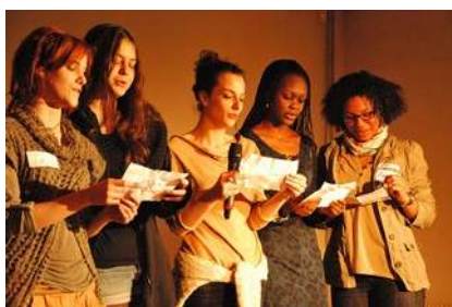
Les volontaires en service civique de l'AFEV : lutte contre les discriminations dans les quartiers populaires