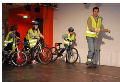
Les parents-accompagnateurs du Vélobus de Saint-Alban Laysse