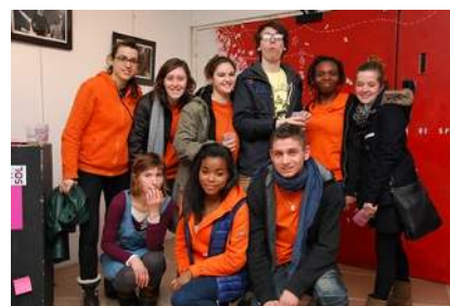
Les volontaires d'Unis Cités